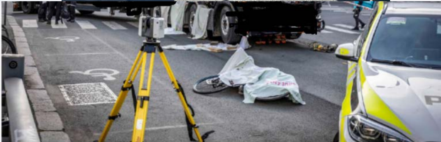
Ulykken skjedde i krysset Ullevålsveien og Waldemar Thranes gate.

Bekymring – flere myke trafikanter uten godt fysisk skille